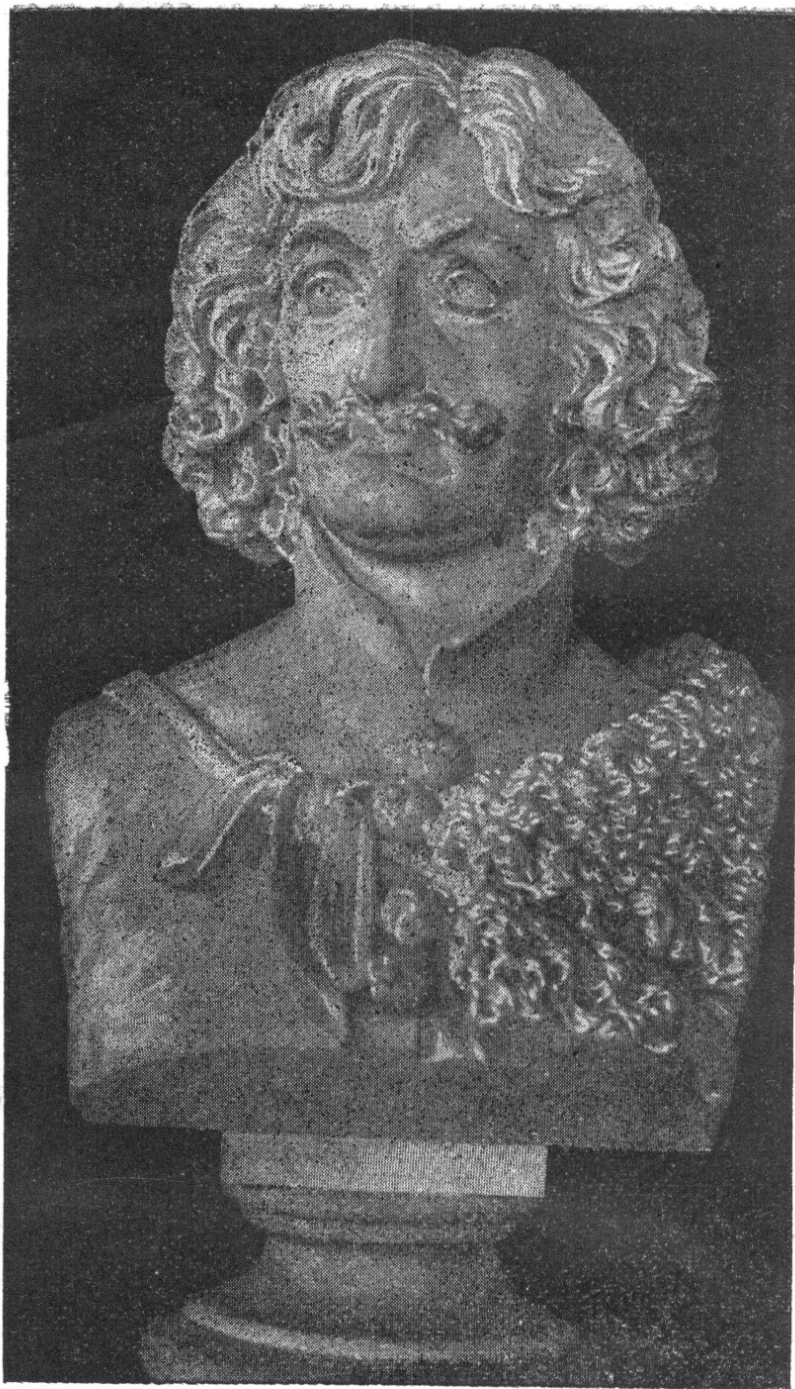
IZSÓ MIKLÓS: ZRINYI, A KÖLTŐ MELLSZOBRA.