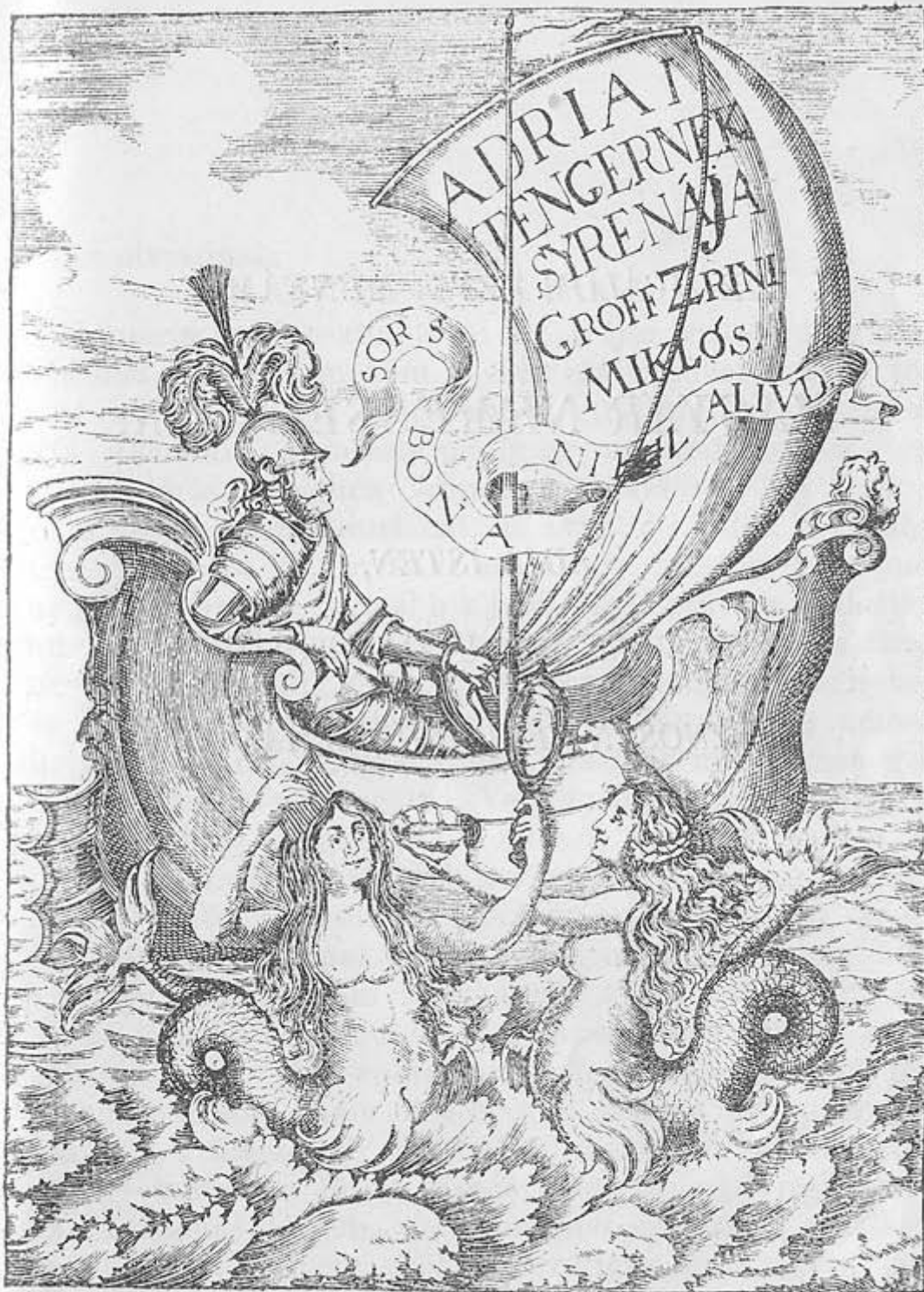
Zrínyi Miklós Szigeti veszedelemének címképe. (Bécs, 1651.)